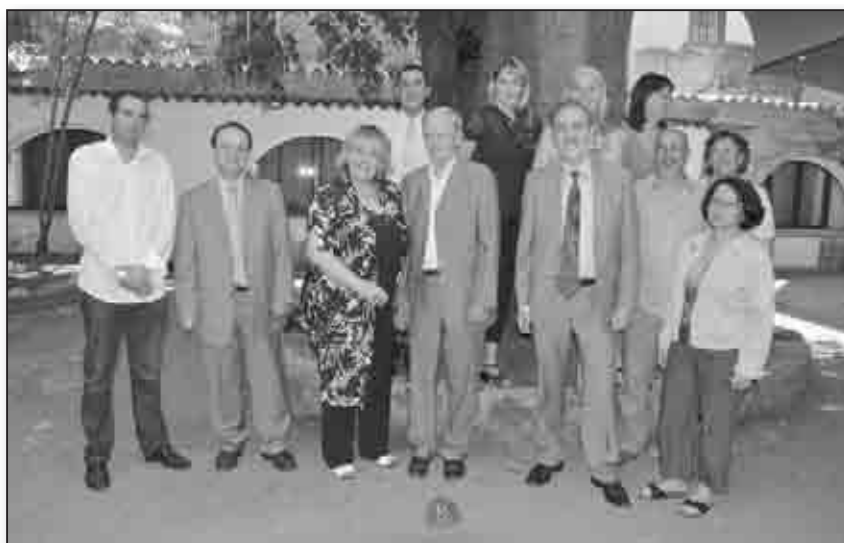
Sous le micocoulier, dans les jardins de l'association «L'Europe en Corse», la délégation du CNFPT et les représentants de L'Europe en Corse, l'ARACT et l'Association des maires de la Corse du Sud

Une rencontre avec la Collectivité Territoriale de Corse augure la finalisation d'une nouvelle génération de contrat de partenariat pour la formation professionnelle territorialisée. Ce contrat, qui sera signé à la rentrée après délibération de l' Assemblée de Corse en juillet, comportera deux volets : le premier concerne la formation des 1304