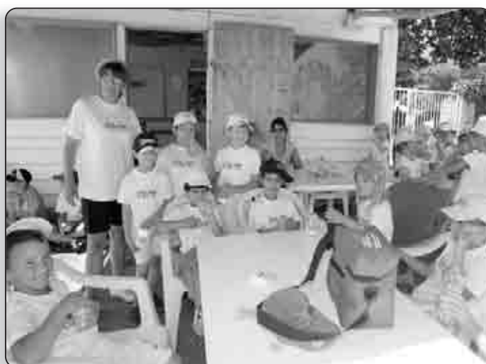
La pause fraîcheur offerte par Zilia