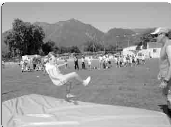
Le saut en hauteur... déjà un certain style