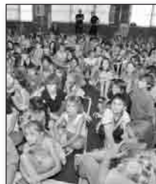
10 classes de Haute-Corse réunies au Conseil Général 2B le jeudi 21 juin 2012