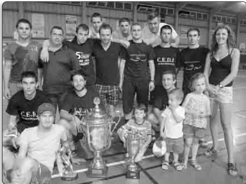
L'équipe CEDI a remporté le trophée pour la seconde année consécutive