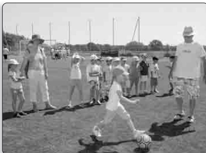
Le foot, ce n'est seulement une histoire de mecs !