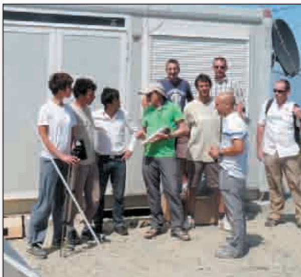
Moyens humains et compétences mobilisés