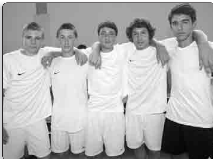
Les gamins ont fait forte impression