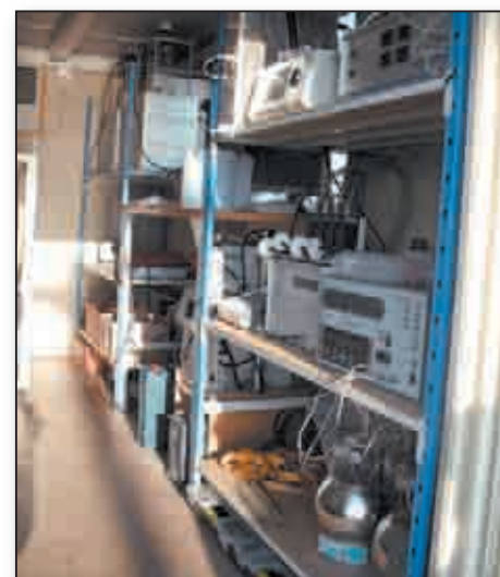
Des instruments dernier cri en matière de suivi et de caractérisation en temps réel de la pollution atmosphérique (gaz et particules)

Vendredi 22 juin, à l'Hôtel «Le Saint-Jean», hameau de Botticella à Ersa, les partenaires scientifiques du projet ChArMEx ont donné le coup d'envoi de la campagne. Une visite de la station de mesures, tout récemment installée sur le site des éoliennes et venant ainsi compléter un réseau de stations disséminées aux quatre coins de la Méditerranée pour le suivi