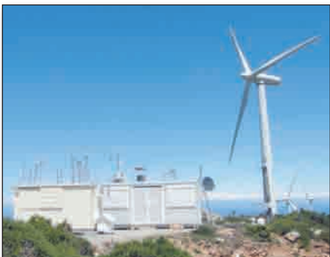
Installés à plus de 500m d'altitude, sur le site des éoliennes, à Ersa, les conteneurs constituent la station de mesure Charmex